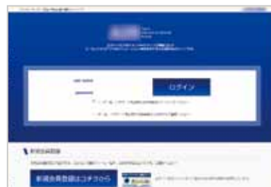
※画像はサンプルです

また、お見積りの機能や、製品のご注文ページがあると便利です。それと関連して、在庫情報が分かる機能や、お問い合わせのページも必要となるでしょう。