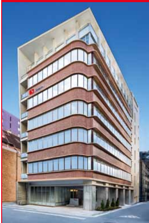
株式会社シモン 本社

金山印刷株式会社の取引先として今回は中央区日本橋茅場町3-3-1に所在する株式会社シモンを紹介する。