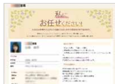
※画像はサンプルです

また、お問い合わせページも必須で、お客様から受領したお問い合わせは一覧表示できます。どの営業職員が一番お問い合わせを受けているか、ということも分かります。