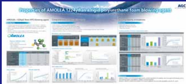
CPI 2019 (Polyurethanes Technical Conference) 開催国: オランダ(アメリカ) ※Best Poster Presentation Awards受賞