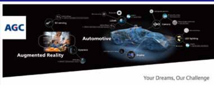
Photonics West 2020 開催国: サンフランシスコ(アメリカ)

製品の本質を正確に捉え、ユーザーにわかりやすくをカタチにしていきます。 パンフレット・カタログ・POPなどのデザイン制作から印刷まで一貫して対応いたします。 長年の経験を生かし、安定したクオリティの高いデザイン制作が特長です。 弊社のデザイナーは大手企業各社、学校関係より高い評価を頂いております。